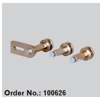
Order No.: 100626

Fixturen kan lutas så tryckplattan vinklas \pm 10^\circ det innebär stora fördelar om fordonet lutar något eller om motorn är upplyft vid kopplingsbytet.