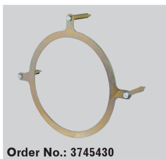
Order No.: 3745430

Fixturen kan användas på många sätt. På aggregatlyft, verkstadskran, groplyft mm. På så vis kan cDISK användas både ovanifrån och underifrån.