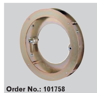
Order No.: 101758

cDISK Evo bus rullarsats För Evo bus finns en sats extra tillbehörullar som erfordras